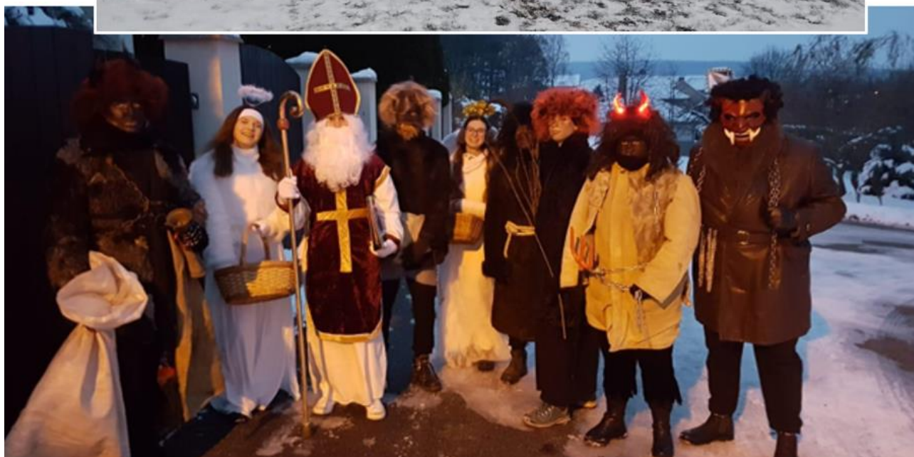
Adventní tradice v naší obci