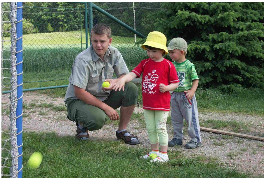
Foto:dětský den na sportovišti