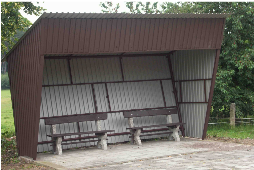
foto: nová podoba autobusových zastávek