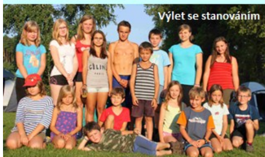
Výlet se stanováním