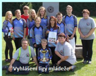
Vyhlášení ligy mládeže