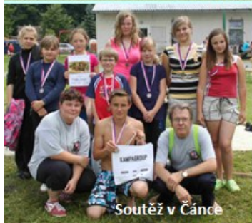
Soutěž v Čáncé