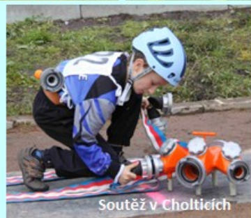
Soutěž v Cholticích