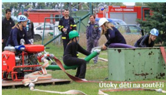
Útoky dětí na soutěži