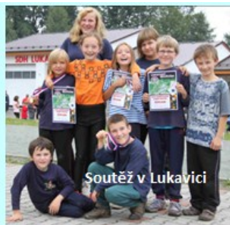
Soutěž v Lukavici