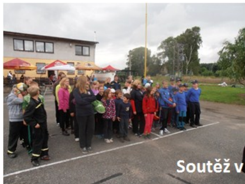
Soutěž v Olešnici