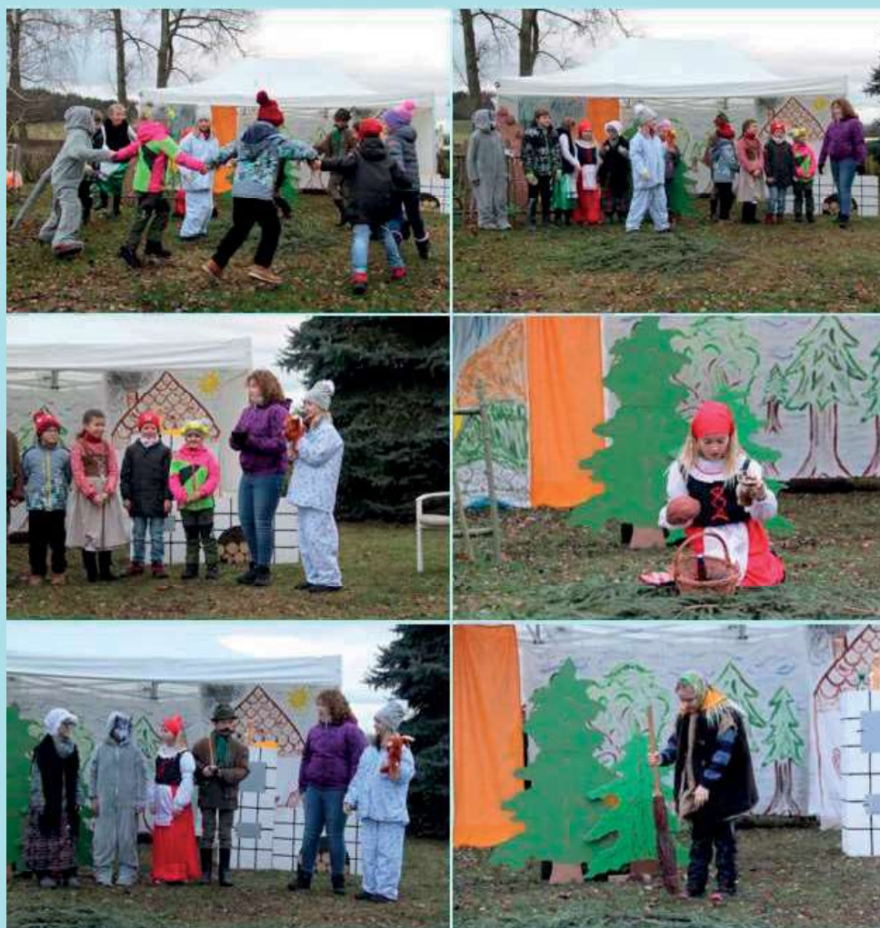
Foto z vánoční besídky 7.12.