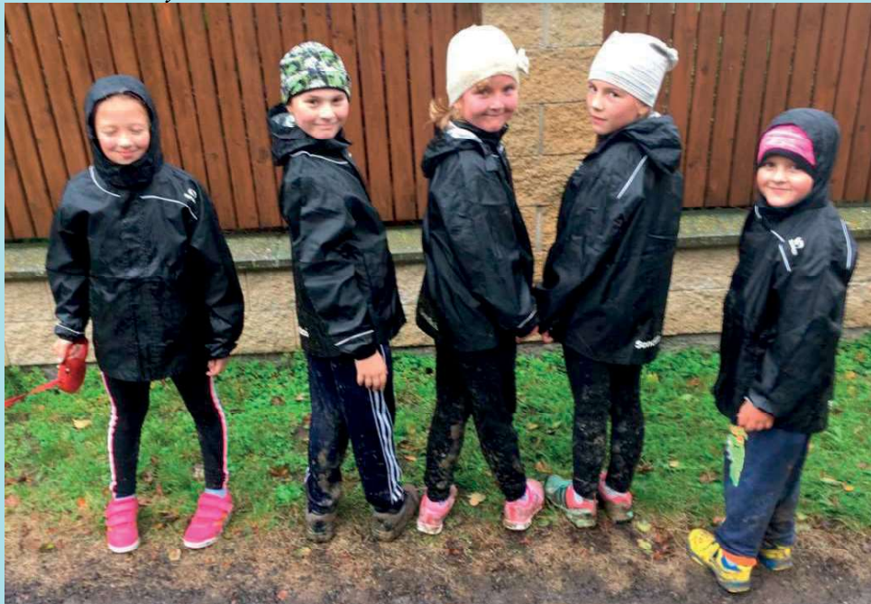
... přespolní běh v „polních“ podmínkách