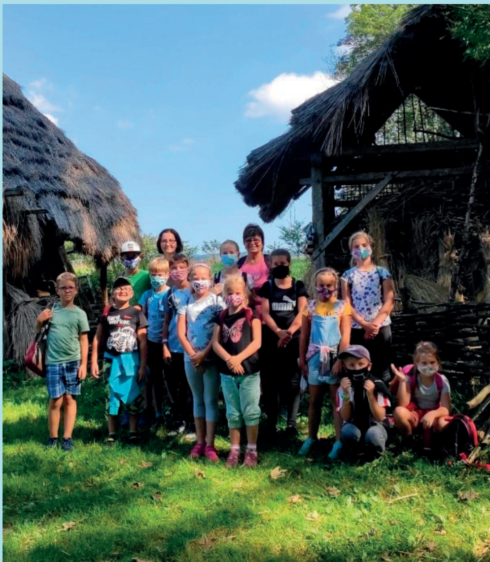
Exkurze školy do Orlických hor „13. století“

Zpravodaj obcí Olešnice a Hoděčín Prosinec 2020